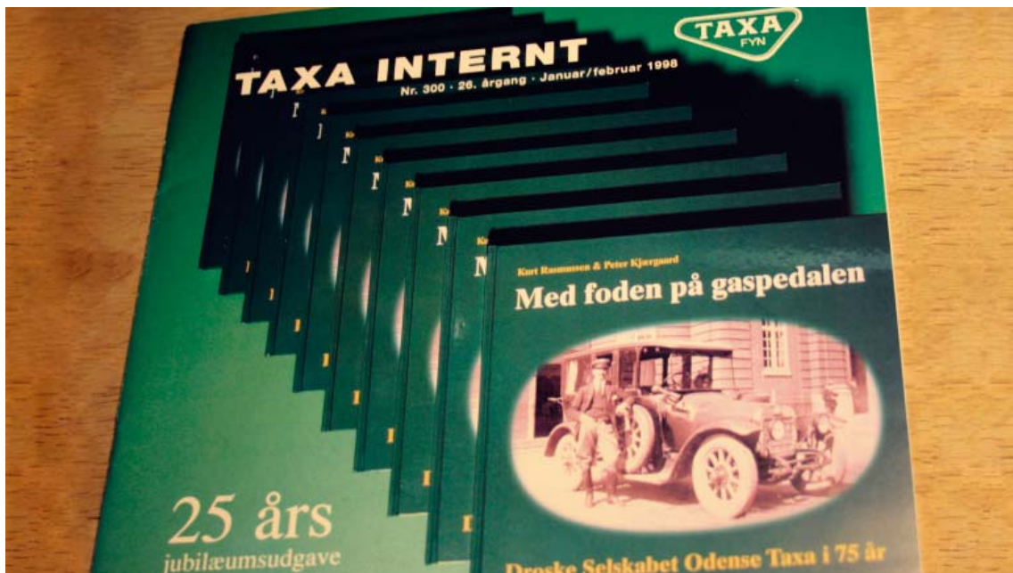
I januar 1998 udkom Internt i denne 25-års jubilæumsudgave