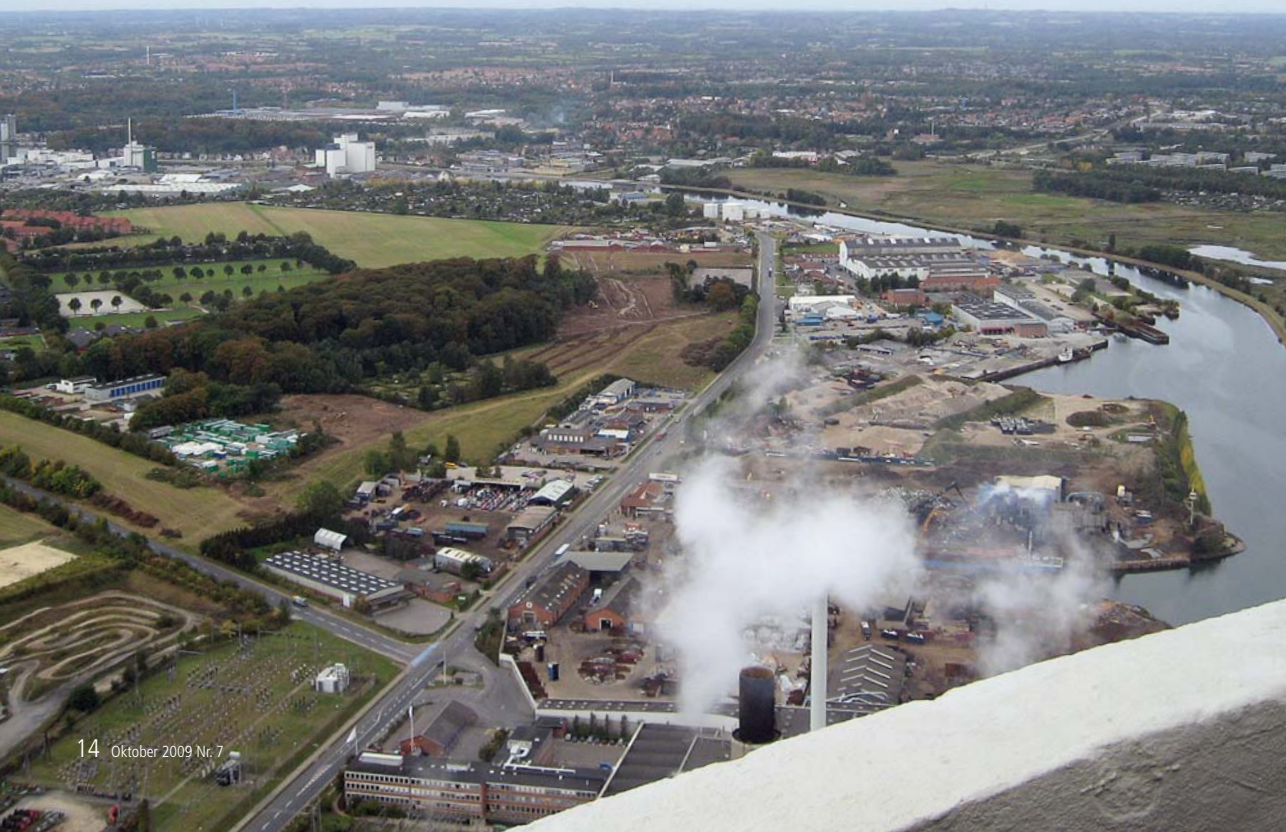
Udsigt fra skorstenen på Fynsværket.