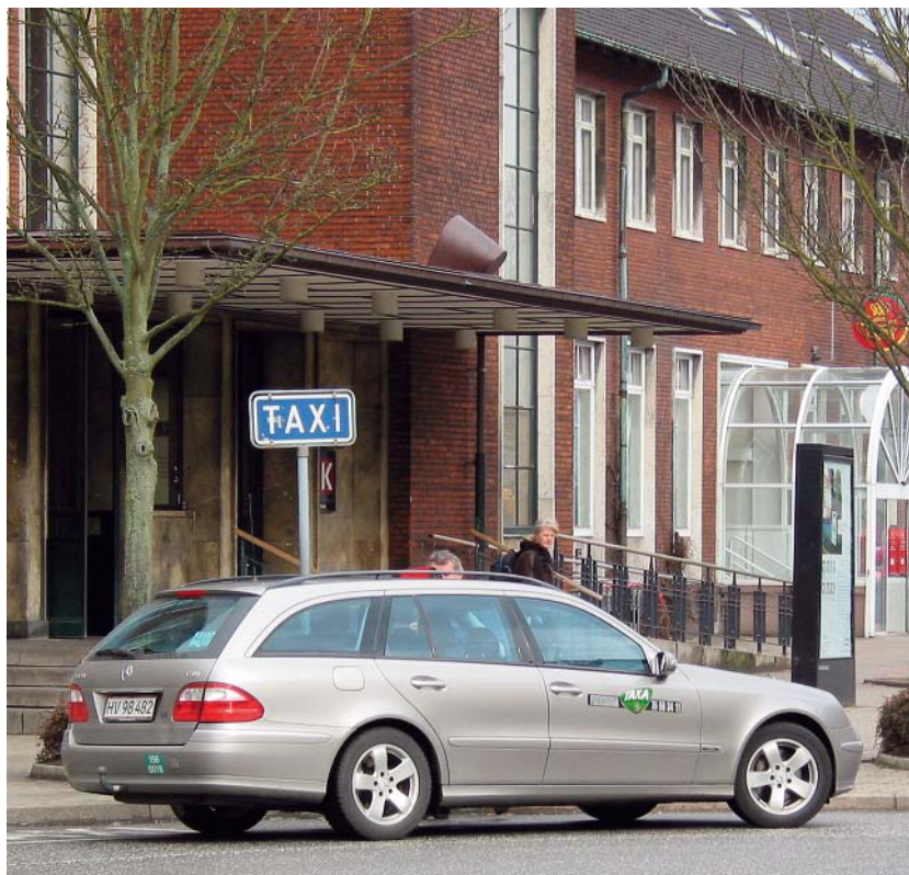
Fra Fredericia Banegård.

Formanden fik dog først overraskende punkterne under punktet Fredericia på selve bestyrelsesmødet, hvorfor punkterne ikke vil kunne blive behandlet før bestyrelsesmødet den 31. august 2009.