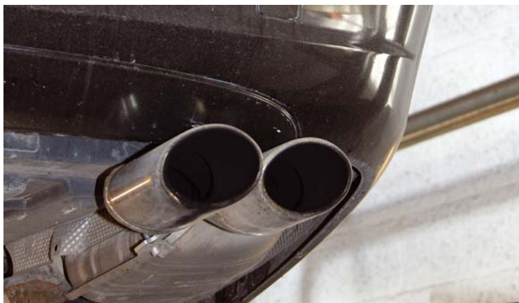
Er vi uansvarlige erhvervsfolk, som bare vil køre rundt i store diesel-osere osv?

Så vidt vides står der ikke politikere klar med en taxi-hjælpes pakke, hvis noget går galt i vognmandens forretning.