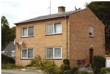
I Dronningemaen i Svendborg er der en ledig lejlighed.

Der er pt. 3 lejligheder til udlejning i virksomhedens ejendomme - 2 på Hjallesøvej 10 i Odense og 1 i Dronningemaen 44 i Svendborg. Udlejes fortrinsvist til medlemmer - ved flere interesserede er det ancienniteten, der afgørende. Interesserede kan henvende sig til administrationen.