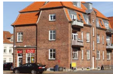
I Hjallesøvej 10 i Odense er der to ledige lejligheder.