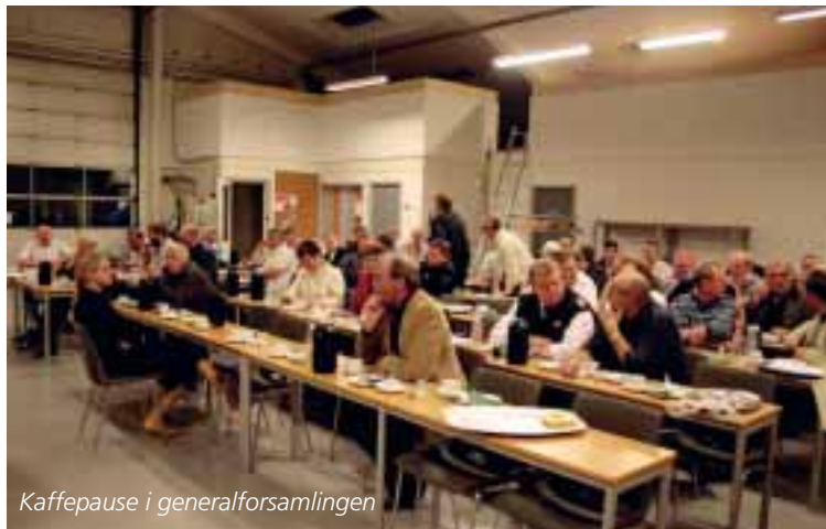
Kaffepause i generalforsamlingen

Den regel har branchen selv været med til at indføre, og der kan være meget fornuft heri. Kommunen har pligt til at tage hensyn til forsyningssikkerheden i byen, og det er en del heraf.